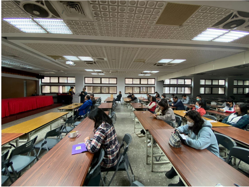
教務主任補充說明