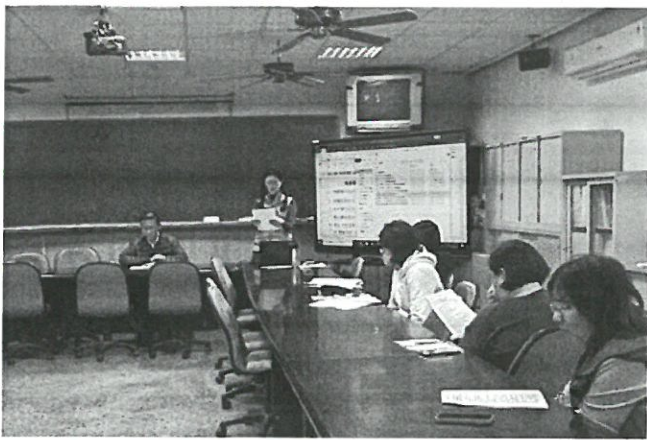
說明：校長主持會議