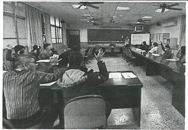
說明：委員舉手表決通過議程