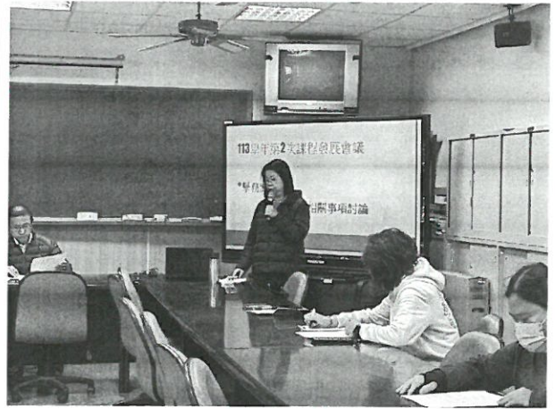
說明：學務主任說明校外教學計劃