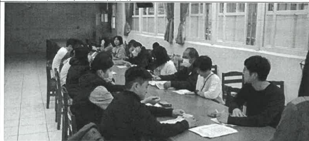
說明：教務處期末領域會議工作報告