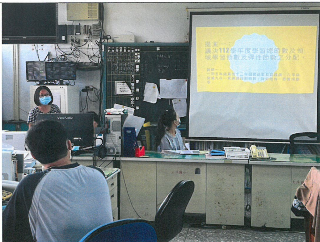
照片說明：議決學習總節數及領域學習節數與彈性學習節數之分配