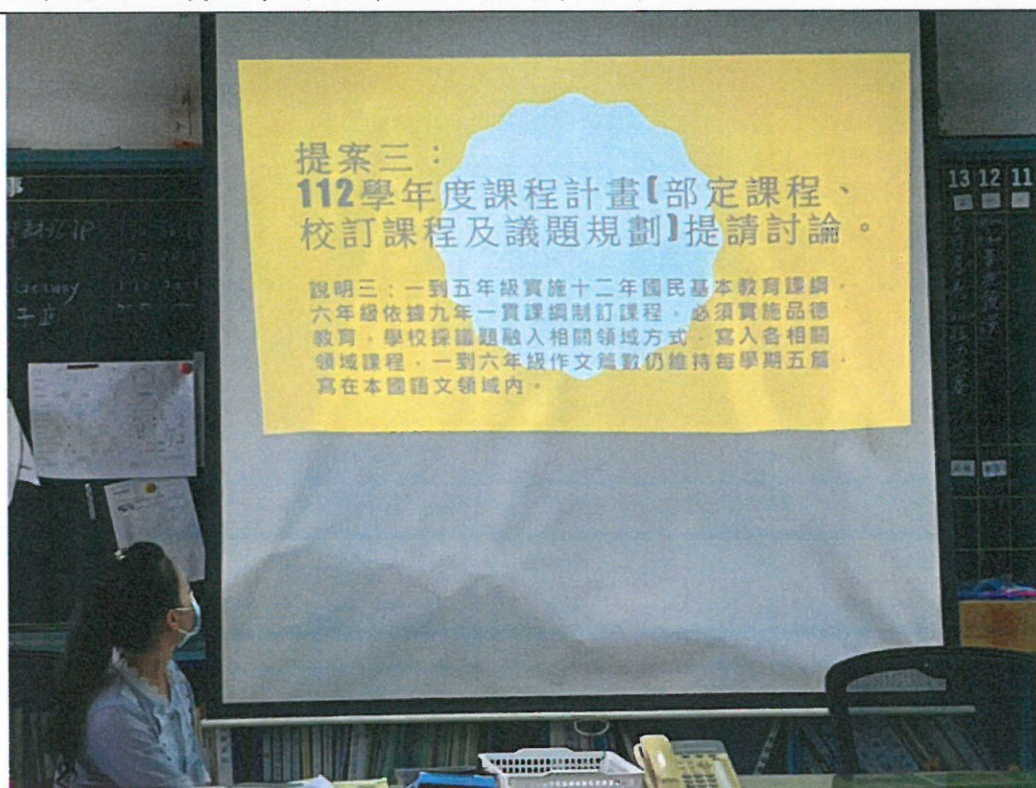
照片說明：通過本校 112 學年度課程計畫