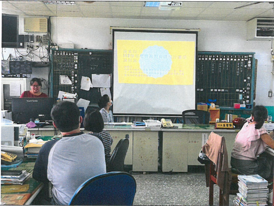
照片說明：輔導主任說明 112 學年度特殊教育課程規劃