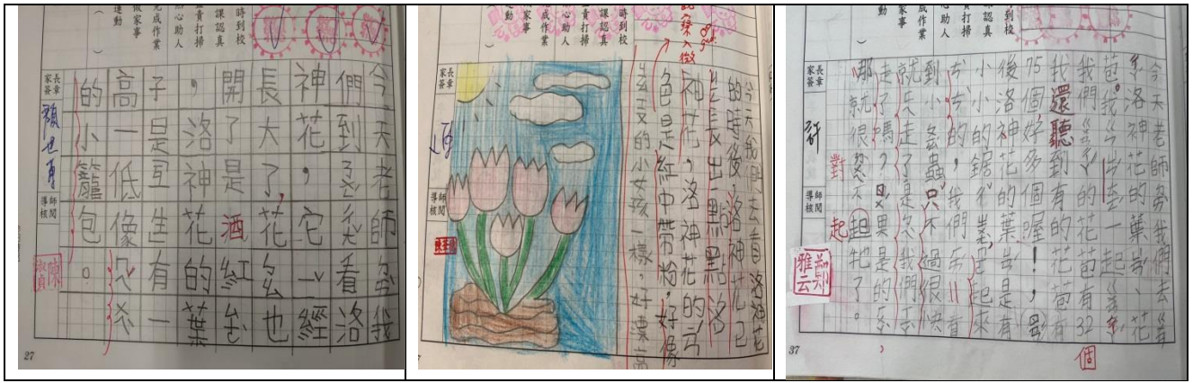
圖四：「有蝴來稻-螺陽秘境踏查」學生小日記作品示例