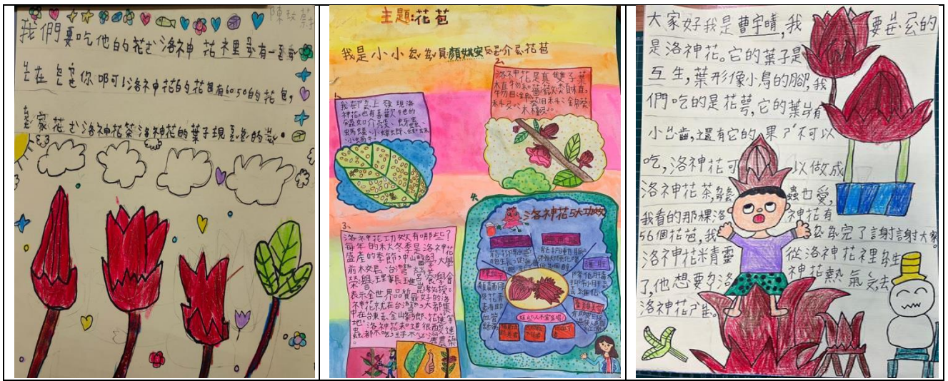
圖五：「有蝴來稻-螺陽秘境踏查」學生洛神葵海報作品示例