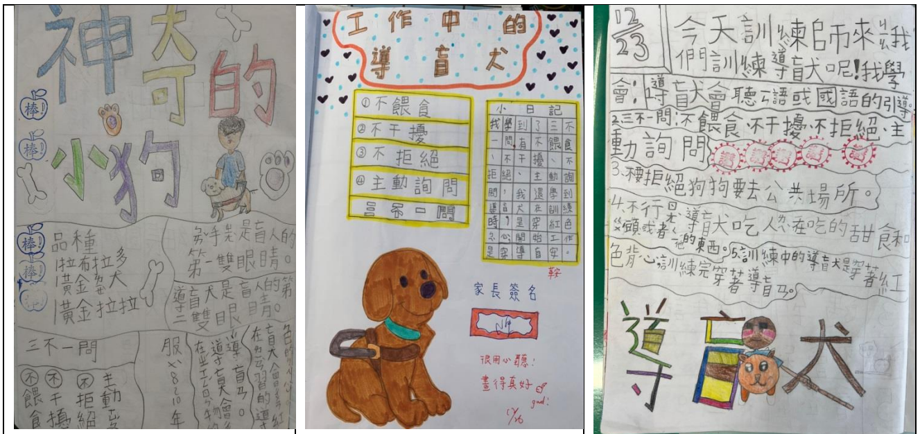
圖六：「有蝴來稻-螺陽秘境踏查」學生參加講座心得示例