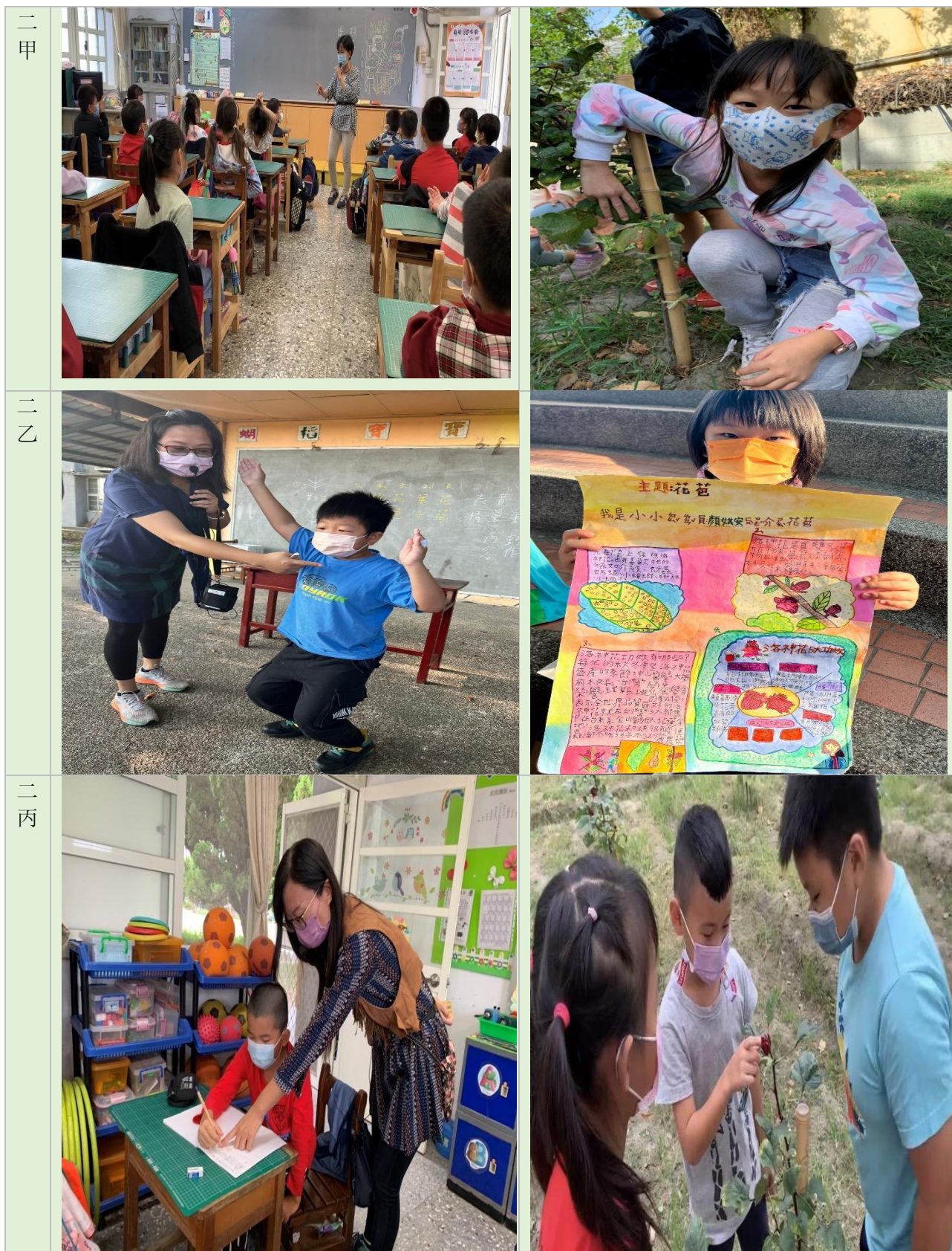
圖二：螺陽國小「有蝴來稻-螺陽秘境踏查」二年級各班教學照片

此外，在課程實施之際，也需要同步進行課程效果的檢核，教師教學當下所覺察到的任何學生回應，所觀察到的照片及上課反應，都是用來改進和修正教學設計的重要依據(如圖二)。