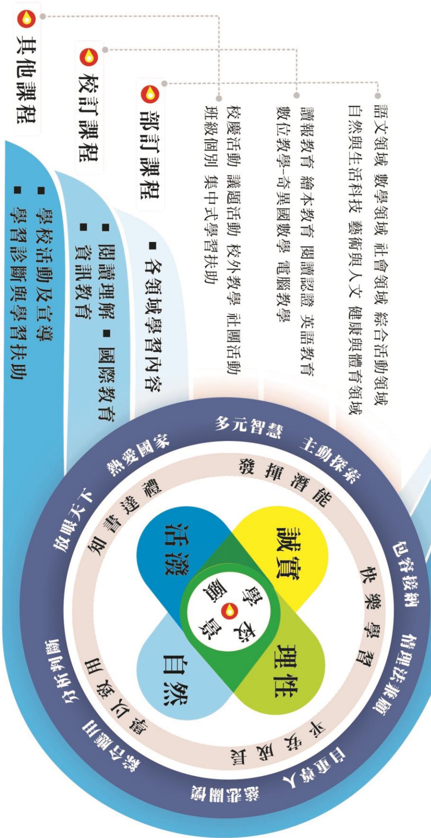
課程地圖(以圖表或文字表述)