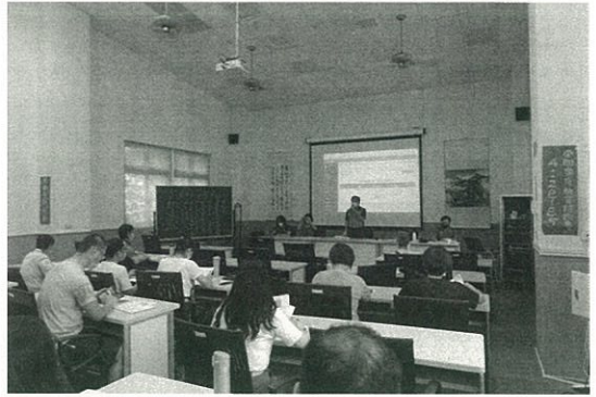
111 學年第一學期期初課程發展委員會會議情形