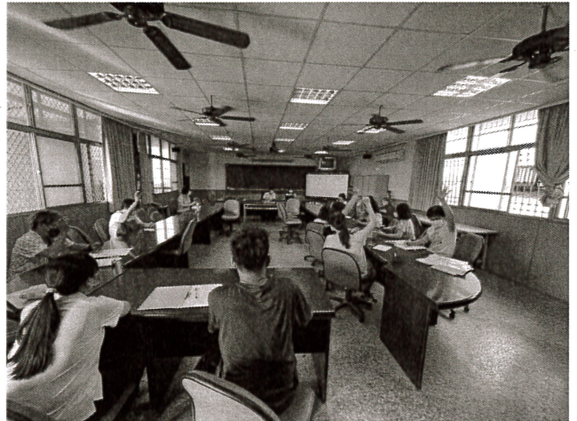
說明：委員投票通過議程