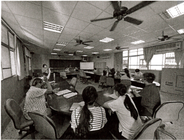
說明：委員投票通過議程