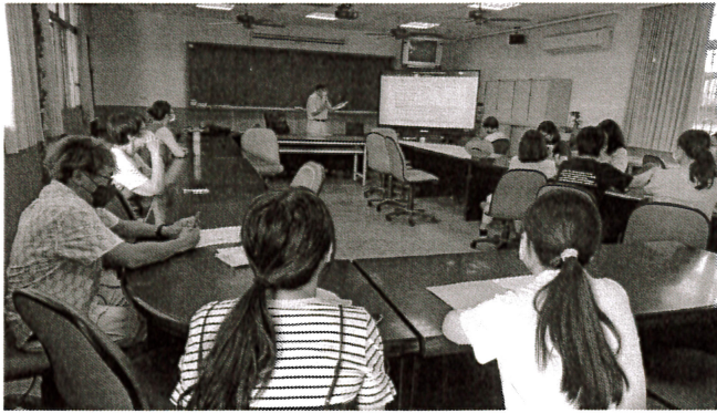
說明：教務主任主持會議