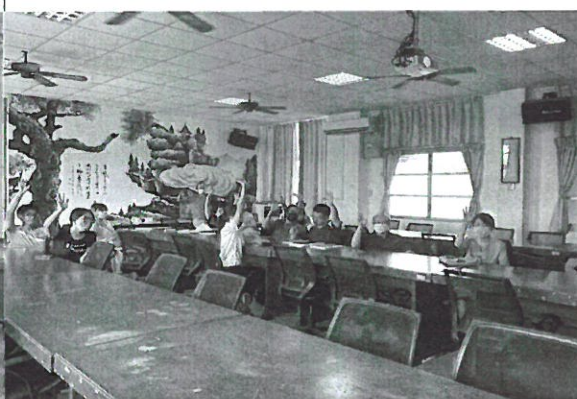
照片說明： 全體委員投票

拾、散會：中華民國 112 年 06 月 07 日 (三) 下午 13 時 20 分