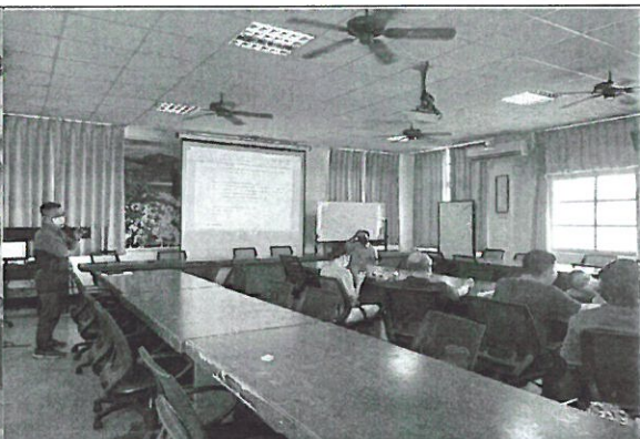
照片說明： 公開授課說明