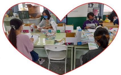
照片說明二：教科書評選委員會召開情形