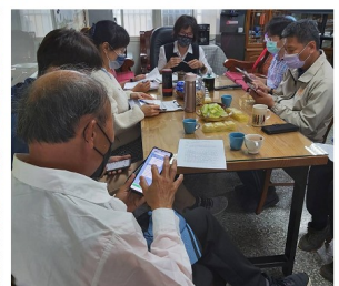
照片說明一：課程發展委員會與教學研究會召開情形