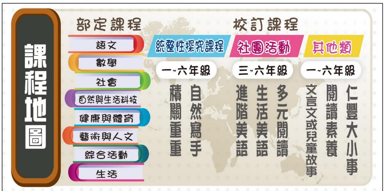
圖 1：仁豐國小課程地圖架構

圖 1 以上述兩種課程繪製成仁豐國小課程地圖架構，表 1 進一步整理本校部定課程及校訂課程各年級每週上課節數一覽表，表 2 則是舉例本校「自然寫手」校訂課程的課程地圖，從中可見其緊密結合學生圖像「仁豐素養五力 Go！」，並呈現一～六年級課程之間高度縱向之統整。