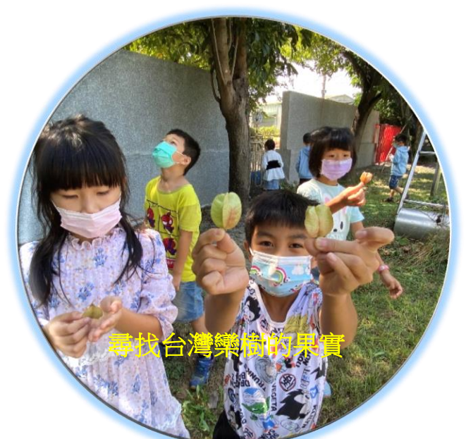
尋找台灣藥材的果實