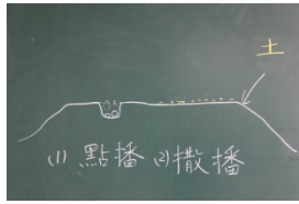
圖 4 種子點播與撒播