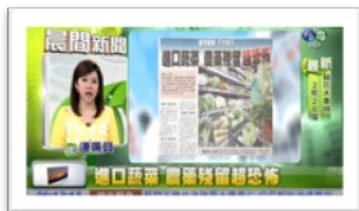
圖 1 youtube 影片觀賞:進口蔬菜超恐怖

和學生討論「進口蔬菜超恐怖」(圖 1)新聞議題，引起學生注意蔬菜中農藥殘留的問題及對健康的影響，引發學生自種蔬菜的動機。