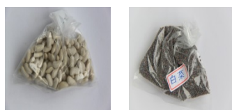
圖 2 扁豆種子 圖 3 白菜種子

從種子的大小可以知道，通常 較大顆種子 (上圖 2)都採用「點播」方式， 較細小種子 (上圖 3)則用「撒播」方式種植(如下圖 4)。