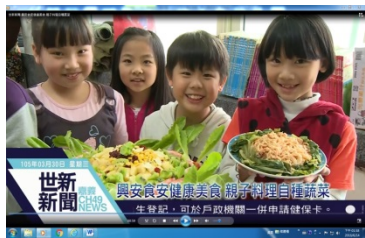
圖 8 影片觀賞：08_能源村_食物里程