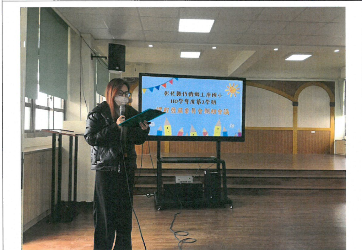
說明下學期藝文比賽內容及說明因應疫情停課計畫