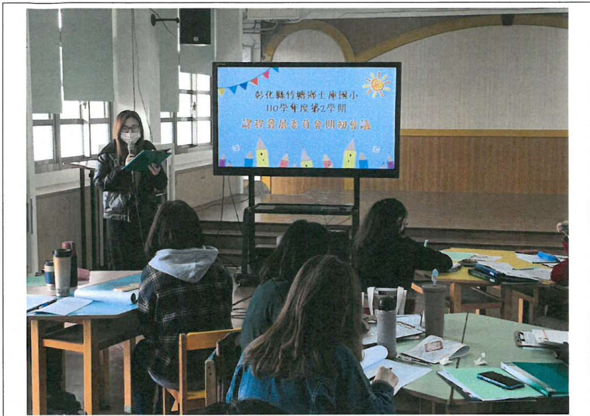
教務組業務報告有關下學期雙語計畫公開課規劃