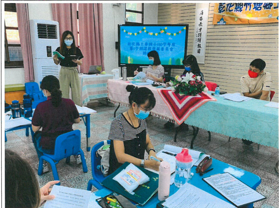
教務組業務報告本校推行課程內容及說明因應疫情停課計畫