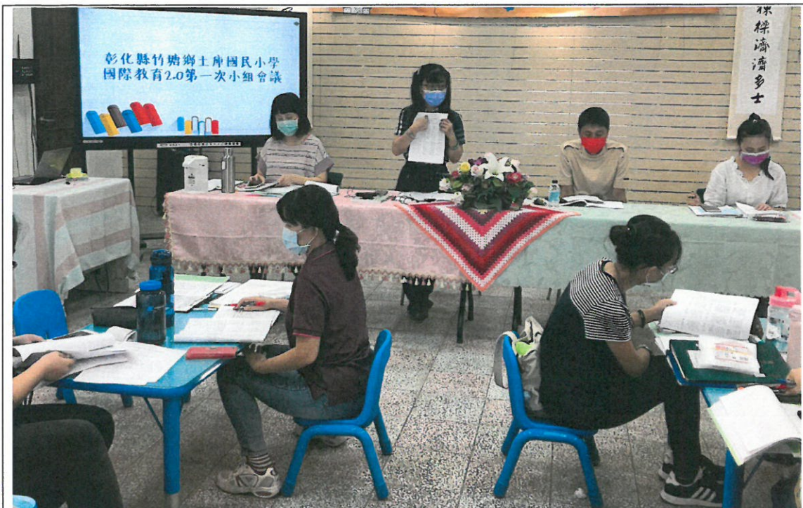
校長說明本校國際教育指標實施內容