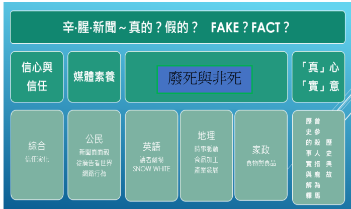
(三) 課程計畫時程與內容：