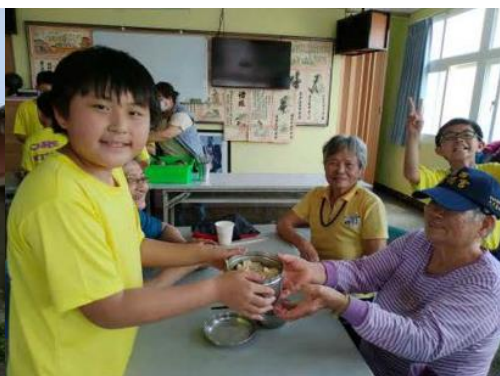
服務學習-與老人共餐