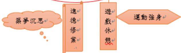
彰化縣螺青國民小學 111 學年度 四 年級彈性課程節數分配表