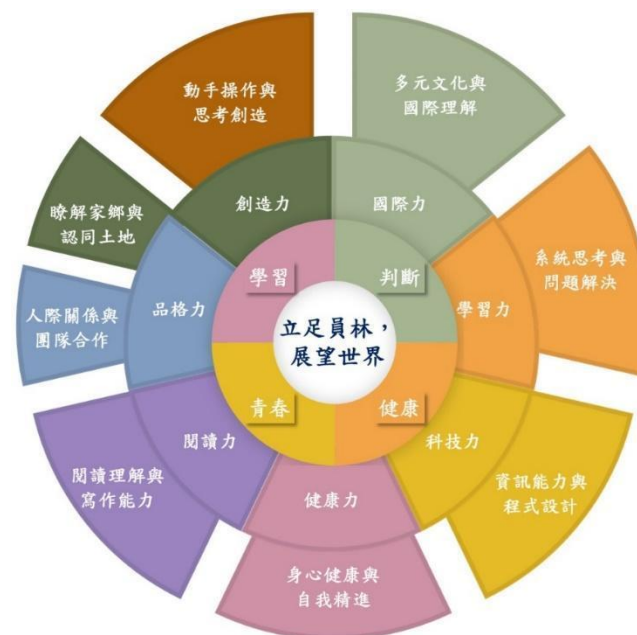
本校學校願景、學生圖像與發展重點