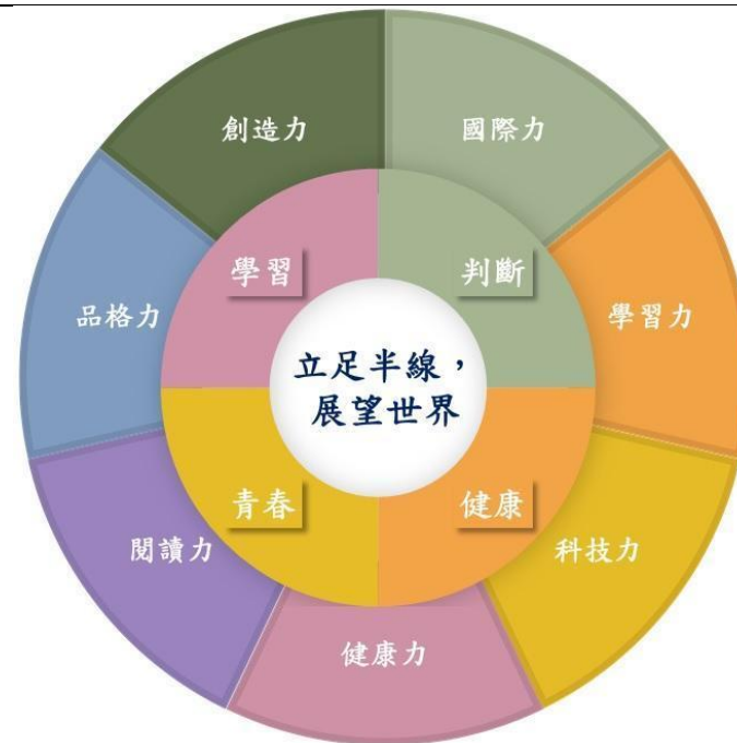
本校學校課程願景、學生圖像