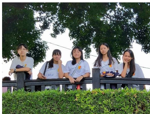
拍攝地點: 老樹公園 影像說明: 在公園與朋友們的合照