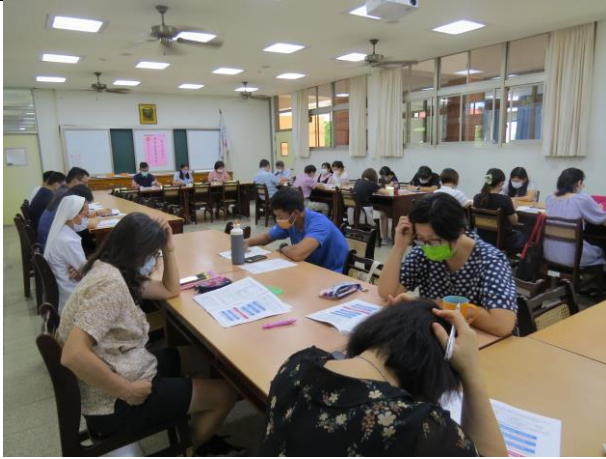
110.09.15 課程發展委員會 會議開始