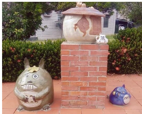
拍攝地點: 窯燒貓村 影像說明: 龍貓家族