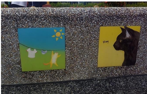
拍攝地點: 窯燒貓村 影像說明: 路邊隨處可見的可愛貓咪小磁磚