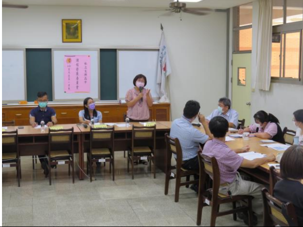
110.09.15 課程發展委員會 專家學者發言