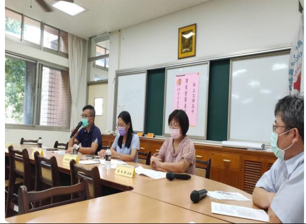
110.09.15 課程發展委員會 家長會長發言