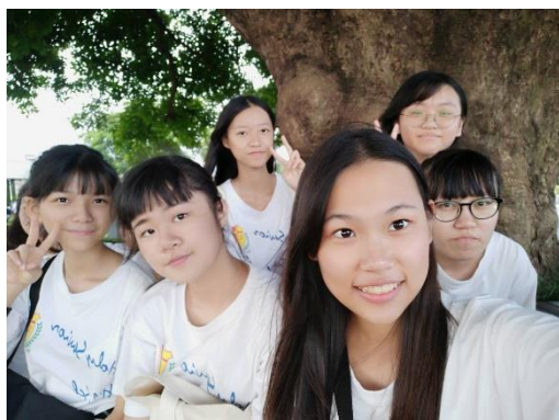
拍攝地點: 老樹公園 影像說明: 夫妻樹下與朋友們的合照