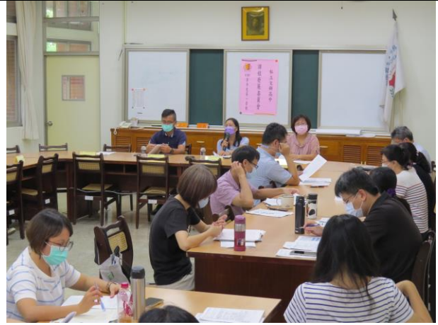
110.09.15 課程發展委員會 校長發言