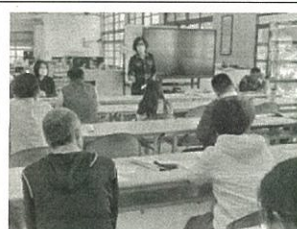
110 學年第一學期期末課程發展委員會會議情形