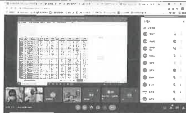
試務組長說明會考試題分析細節