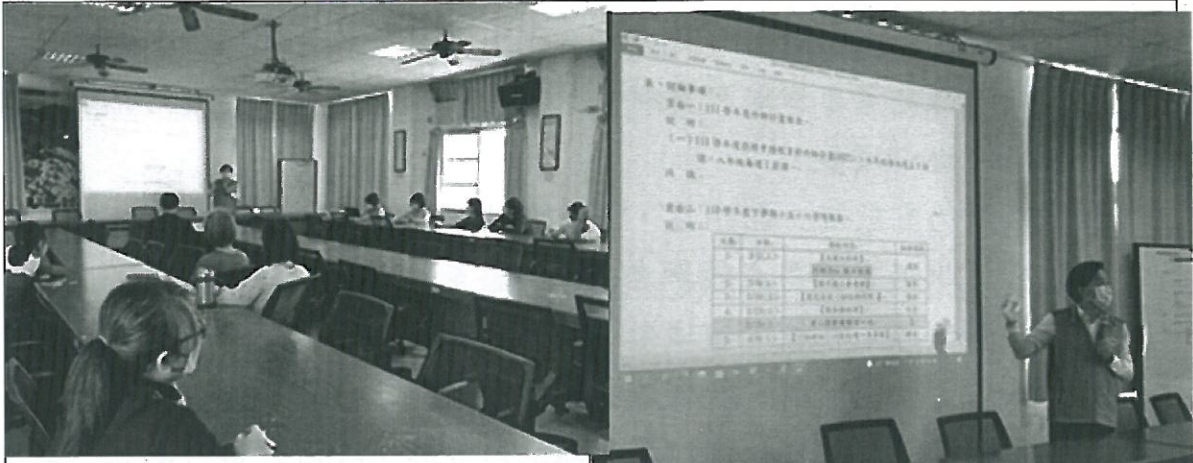
主席致詞、工作報告