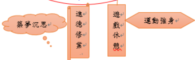
彰化縣螺青國民小學 110 學年度 四 年級彈性課程節數分配表