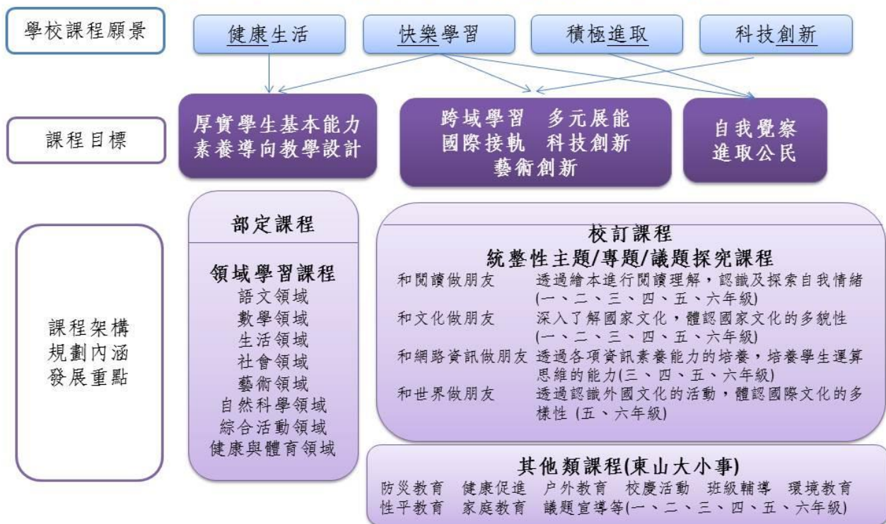
彰化縣東山國小校本課程(部定與校訂)課程地圖

學校課程願景為「健康生活」、「快樂學習」、「積極進取」、「科技創新」，為了達到這些課程願景，學校依「健康生活」、「快樂學習」課程願景設定的課程目標為「厚實學生基本能力、素養導向教學設計」，依「科技創新」、「快樂學習」設定的課程目標為「跨域學習、多元展能、國際接軌、科技創新、藝術創新」，依「積極進取」、「快樂學習」設定的課程目標為「自我覺察、進取公民」。為了達到上述課程目標，除於部定課程厚實學生基本能力外，也利用健康促進的相關活動，希望學生達到「厚實學生基本能力、素養導向教學設計」的課程目標和「健康生活」、「快樂學習」的課程願景，另外於校訂課程的彈性學習課程中規劃「和閱讀做朋友、和文化做朋友、和網路資訊做朋友、和世界做朋友」等主題課程，希望學生達到「跨域學習、多元展能、國際接軌、科技創新、藝術創新」等課程目標和「科技創新」、「快樂學習」的課程願景，並於校訂課程的彈性學習課程中規劃「和閱讀做朋友」主題課程以及於其他類課程中規劃各項議題宣導課程及公民實踐相關課程，希望學生達到「自我覺察、進取公民」等課程目標和「積極進取」、「快樂學習」的課程願景。