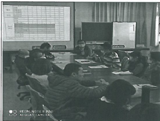
照片說明：畢旅行程說明。