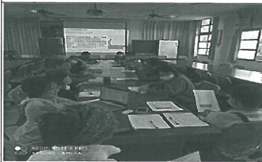
照片說明：110 學年度彈性課程討論。