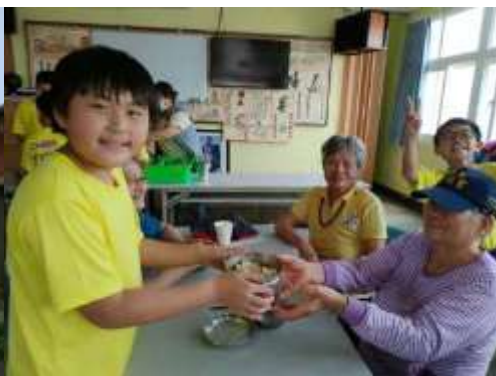
服務學習-與老人共餐