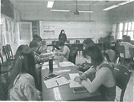
說明：校長主持 109 學年度第二次課發會