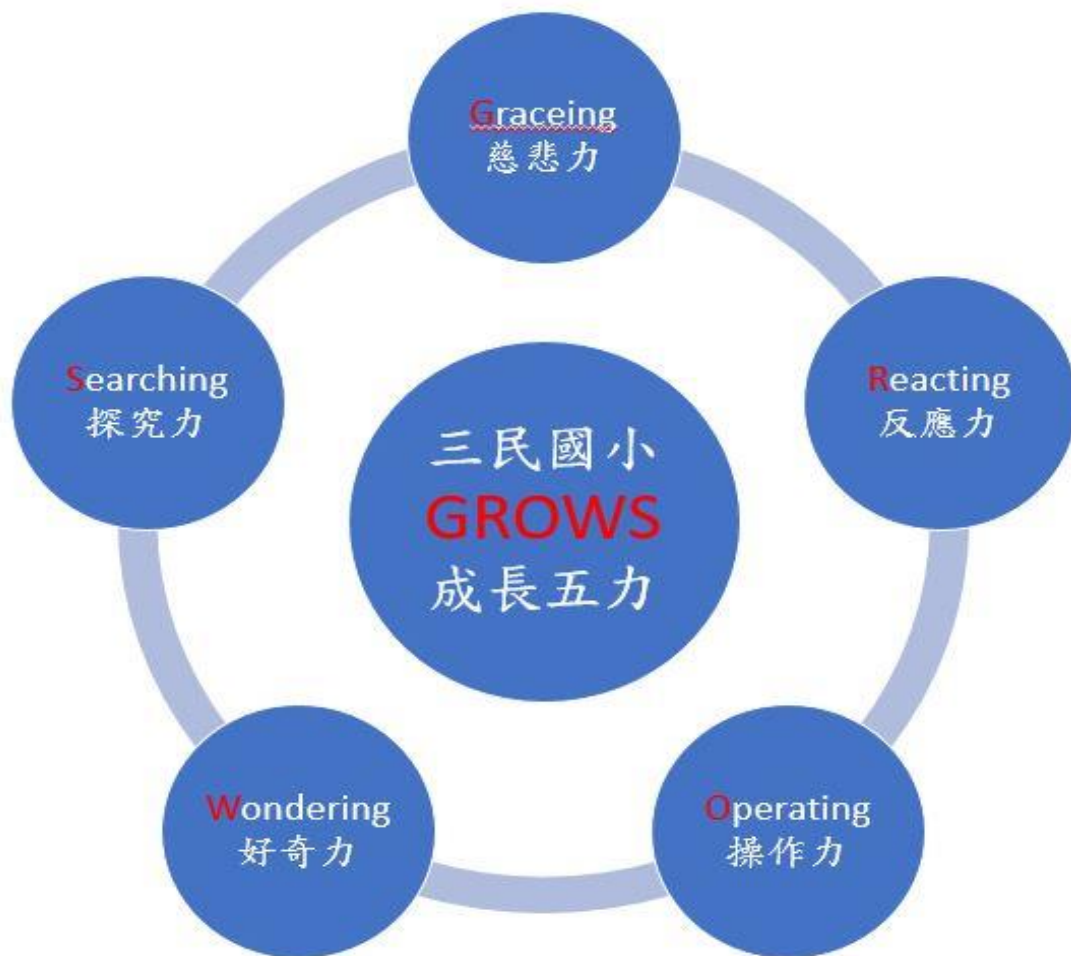
三民國小 GROWS 全人成長五力圖像