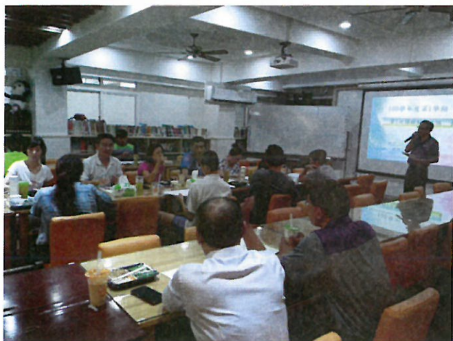
教務主任主持會議