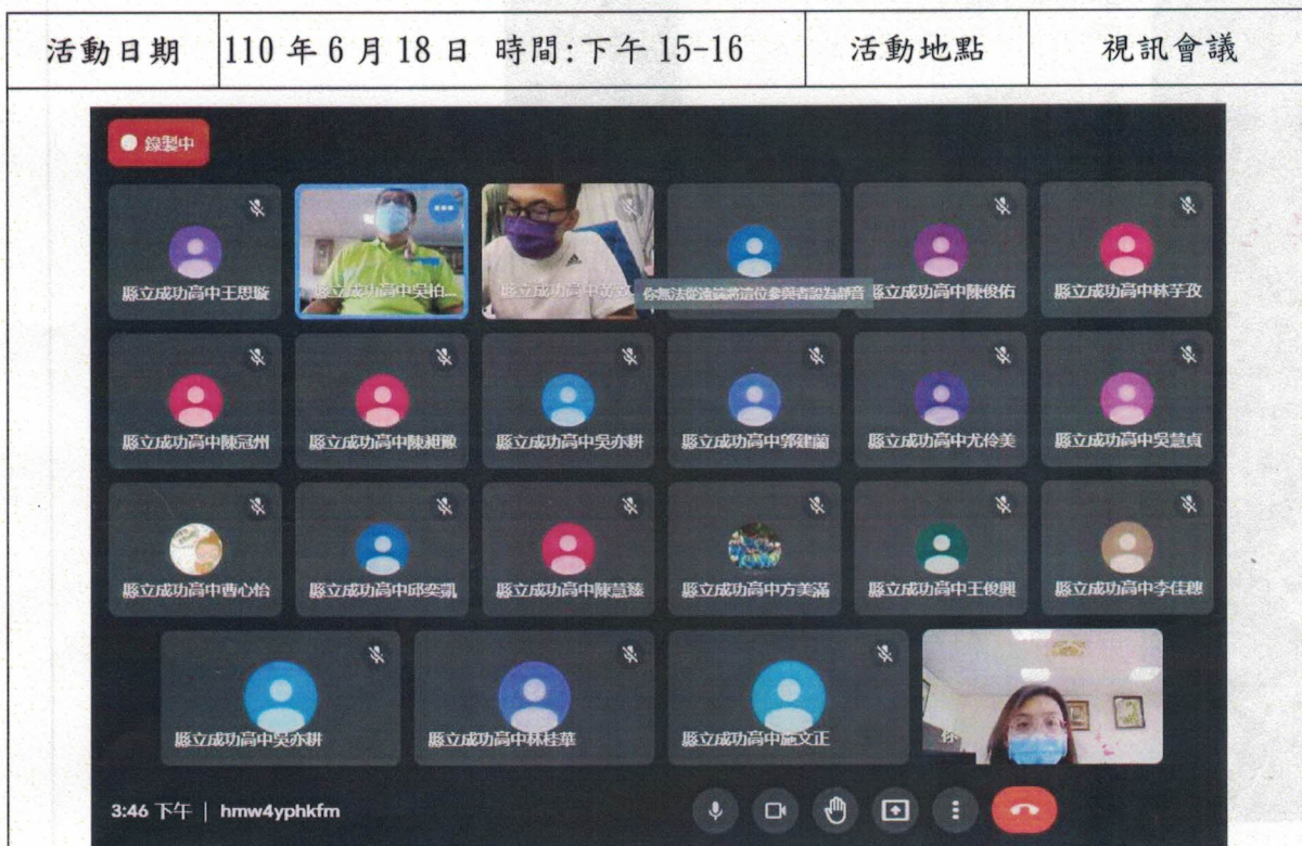
照片說明:【出席 22 位，如附件 1-1】