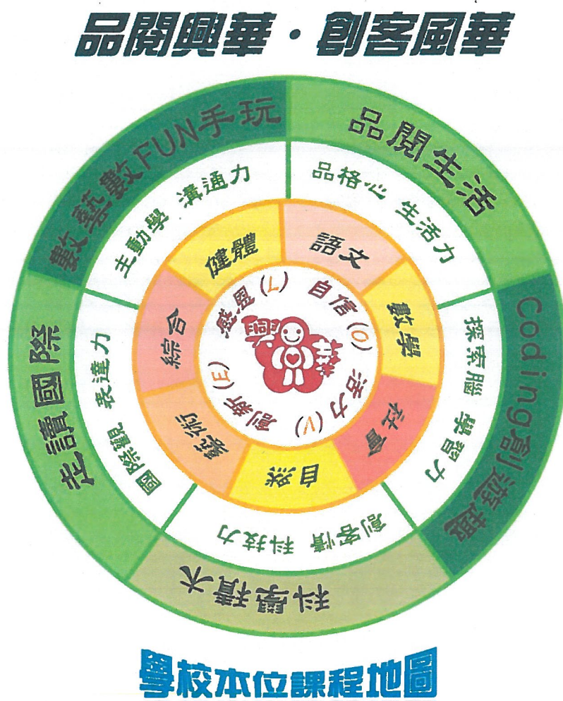
學校本位課程地圖