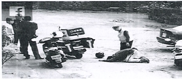
彰化縣員林市有人上傳照片和短文到臉書社群「爆料公社」，指宅急便送貨員跪趴在街道向客戶道歉。

昨天一名宅急便送貨員因延遲送貨，與客戶一家人發生衝突，被網友拍到跪在地上的畫面，引發網友