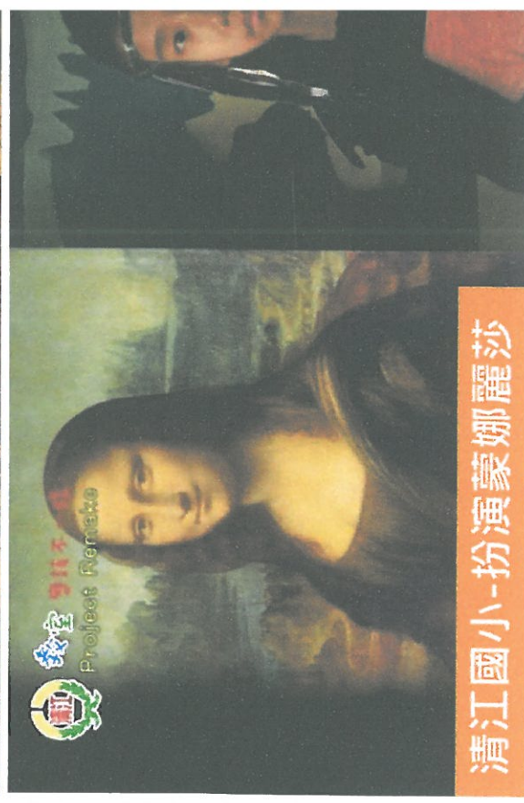
清江國小-扮演蒙娜麗莎