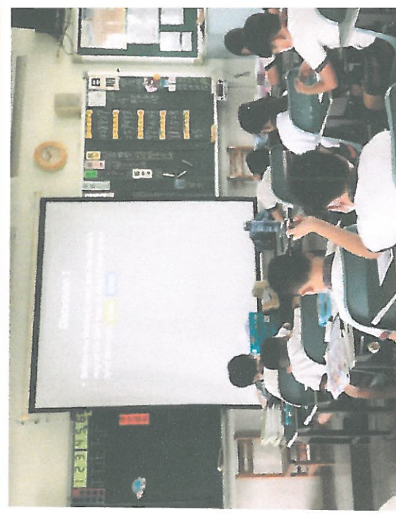
結合英文課，以英文討論繪本三