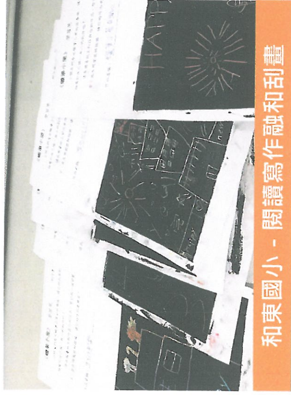
和東國小 - 閱讀寫作融和刮畫