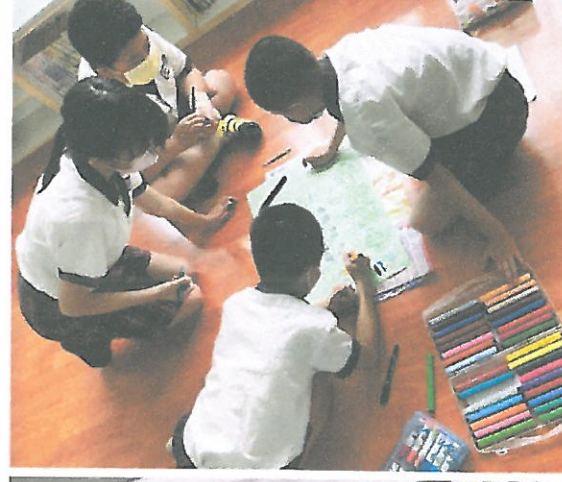
分組討論繪本寓意