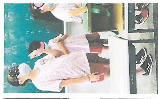
從繪本《停電了》中，發展盲人閉