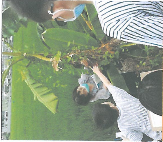
從繪本練習生活觀察