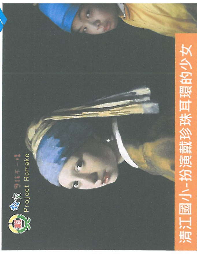
清江國小-扮演戴珍珠耳環的少女