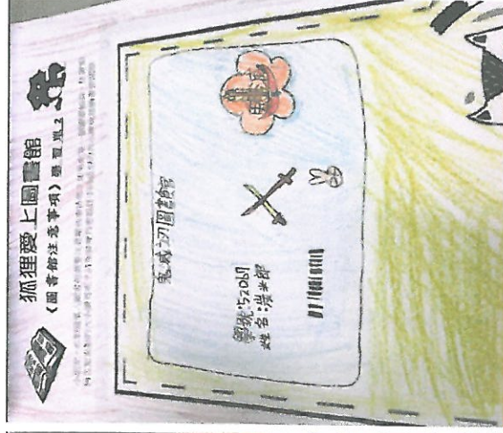
發展設計圖書證活動