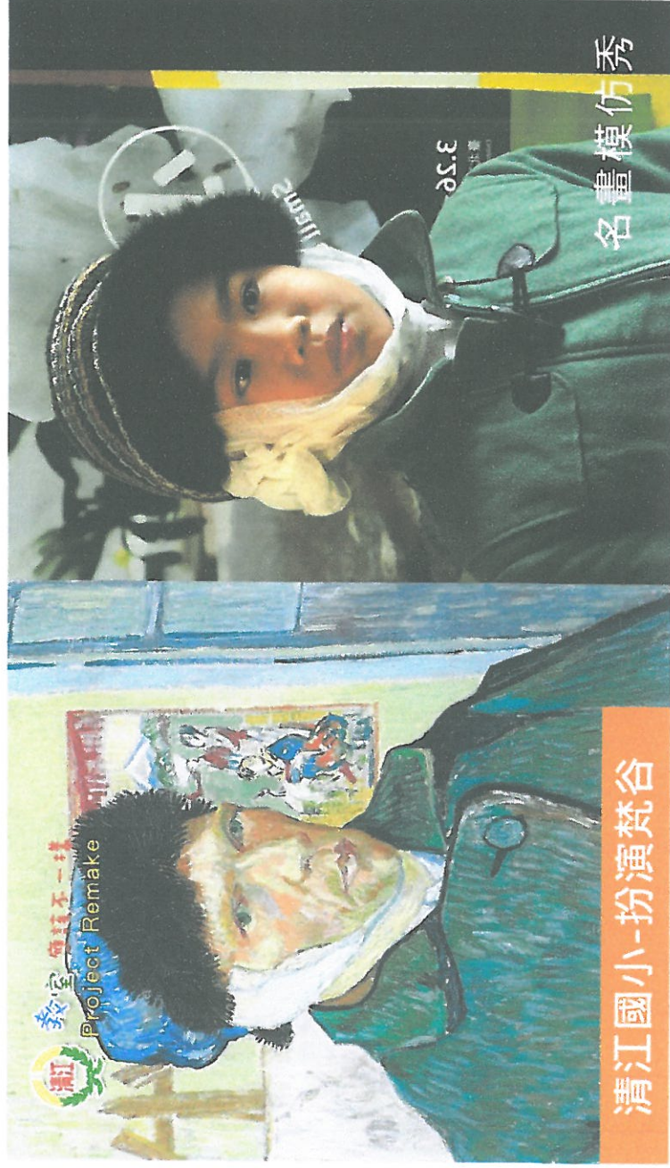
清江國小-扮演梵谷