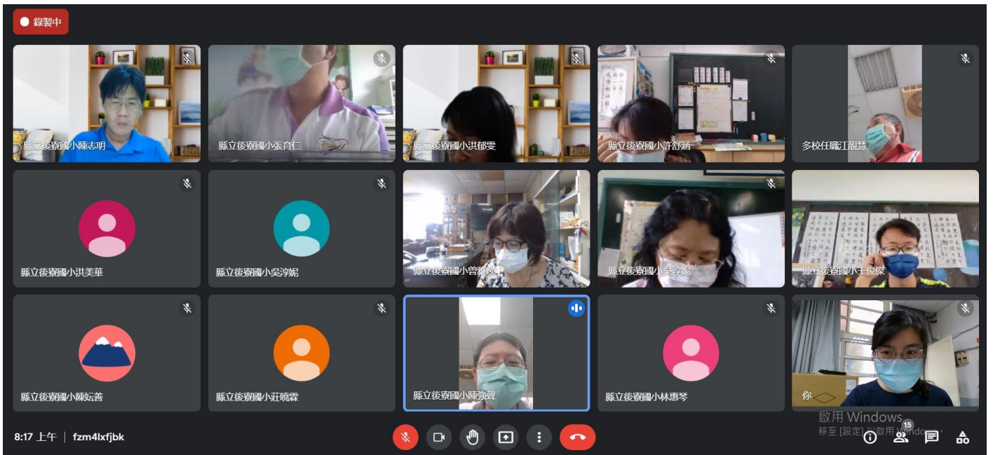
照片說明一：課程發展委員會與教學研究會召開情形