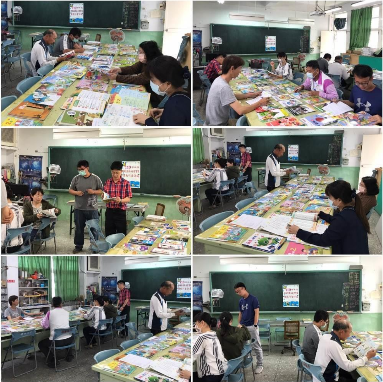
照片說明二：教科書評選委員會召開情形