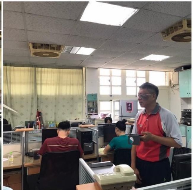
召開 109 學年度上學期第一次課程發展委員會