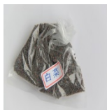
圖 2 扁豆種子 圖 3 白菜種子 從種子的大小可以知道，通常較 大顆種子 (上圖 2)都採用「點播」方式， 較細小種子 (上圖 3)則用「撒播」方式種植(如下圖 4)。