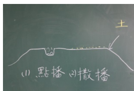
圖 4 種子點播與撒播

圖 2 扁豆種子 圖 3 白菜種子 從種子的大小可以知道，通常較 大顆種子 (上圖 2)都採用「點播」方式， 較細小種子 (上圖 3)則用「撒播」方式種植(如下圖 4)。