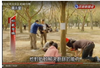
圖 6 影片觀賞: 蚓藏有機