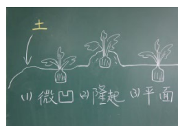
圖 5 菜苗種植方式

5. 實際帶領小朋友種植當季蔬菜，老師可以依實際情況選擇種植地點，如花盆或保麗龍箱，最好能夠種植在土地上。以菜苗種植為例說明如下： (1)栽種下去的菜苗周圍泥土不可重壓，用手播動泥土讓菜苗周圍泥土呈微凹狀，澆水時可以自然積水，讓水慢慢往下滲，有利於澆透泥土。(2)小朋友有時會為了固定菜苗將泥土堆得高高隆起，這時可以和小朋友討論澆水的時候，水可能很快流失，難以澆透土壤。(3)種植後，泥土鋪平再澆水也容易讓水流失，請小朋友仔細觀察並調整種植方式(圖 5)。