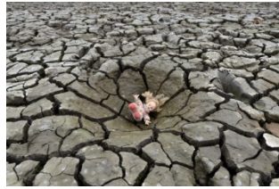
圖 6 土壤嚴重酸化的後果

和學生討論種植蔬菜過程中，如果使用過多化學肥料，以及經常使用農藥除蟲會引來什麼樣的嚴重後果(圖 6)？