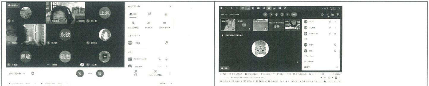
疫情嚴峻，召開課發會，改採線上視訊會議