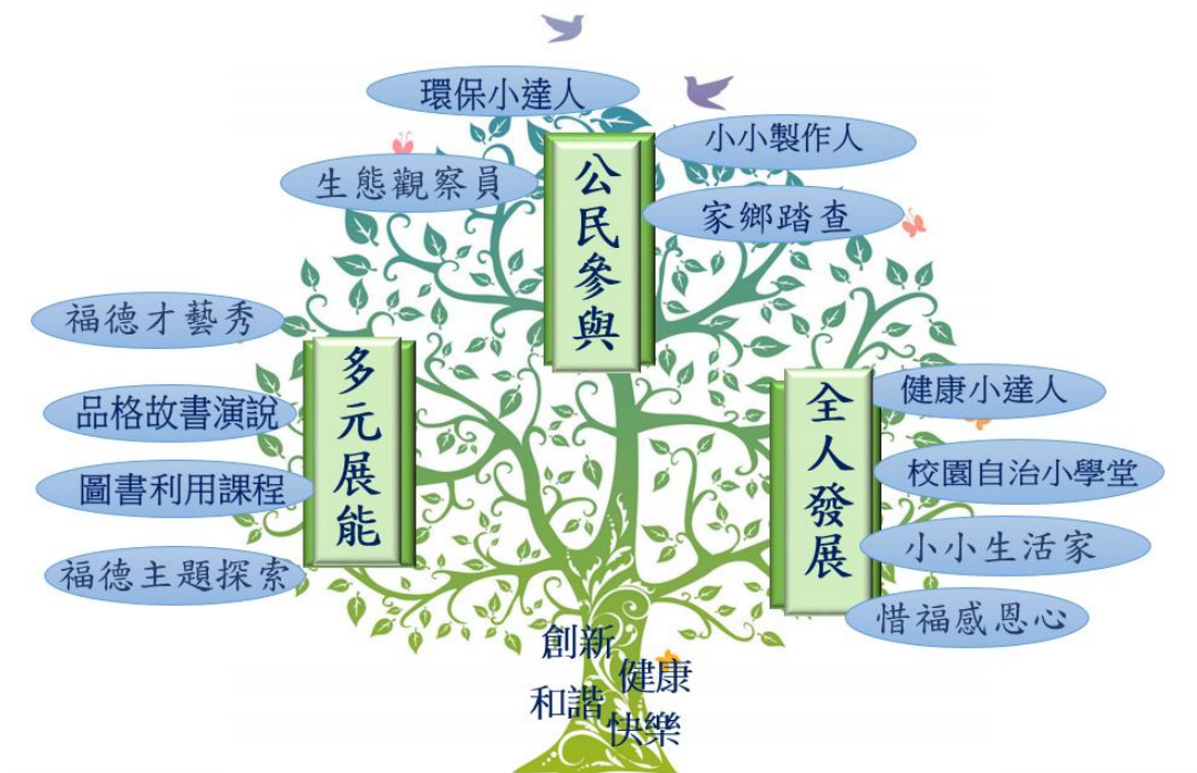
學生圖像與跨領域課程統整